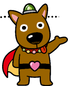
丸亀市社協キャラクター オルデ