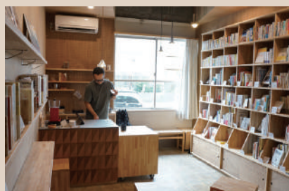
壁一面の本棚。 店主ごとに棚が設けられ、 オススメの本がバラエティ豊かに並ぶ。

露することができます。中には自分の焼いたお菓子を持ってきて売る方もいます。本屋といえば、自分の好きな本を見つけて買って、関わるのは店員との金銭のやり取りくらいですが、この本屋ではコミュニケーションを大切にしています。店主が話しかけることもあれば、お客さん同士が話をすることもあり、イメージする本屋とは違います。