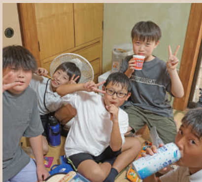
常連のこどもたち。 購入した駄菓子を店内で食べることもできる。

たらいいいし、かき氷や駄菓子屋グル メを、店の特徴に出せればいいかな と思っっています。初めは駄菓子屋を したくてお店を開いたのですが、地 域のこどもたちと顔見知りになっ ていき、また同じ子が来てくれると うれしくて、今はこどもたちが来て ほっとしてくれる居場所になれば いいと思っっています。 オルデ 落ち着いた雰囲気によい 店主のいる駄菓子屋さん、地域 のこどもたちが安心して通える居 場所となっけていて素敵ですね。 オルデ ここに来たきっかけは何 ですか？ こどもたち 友だちに、この場所 を聞いて、それからずっと来てい ます。もうすぐ、遠足があるから 今日はおこづかいを多めに持って 来ました。