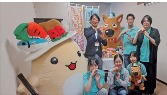
香川大学学生ESDプロジェクトSteeep 様

(株)ヒカリグループホールディングス 様 (田村町日用品食品 多数) (株)ヒカリ 様 (田村町日用品食品 多数) ウェルビースポーツ&スパ 様 (田村町日用品食品 多数) (株)モンテサレービス 様 (柞原町日用品食品 多数) (株)ライフ・イン・シムラランス・コンシェルジュ 様 (金倉町日用品食品 多数)