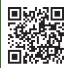
だがしや じゅんぱち Instagram