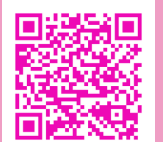
ファミサポ登録用

会員さん限定のイベント案内もさせていただきます。今はまだご依頼のない方もとりあえず登録だけでもいかがですか？ 詳しいことは丸亀市ファミリー・サポート・センターにお気軽にお問い合わせください。