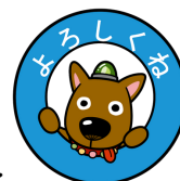
丸亀市社会福祉協議会 公式キャラクター【オルテ】

E-mail famisapo@marugame-shakyo.or.jp http://marugame-shakyo.or.jp/