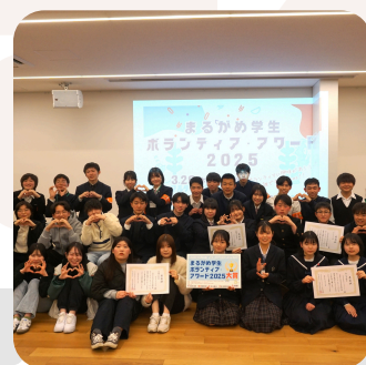
ボランティア・アワード 2025