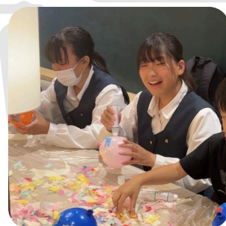
地域活動 まちあかり