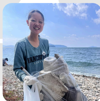
清掃活動 海ゴミ拾い