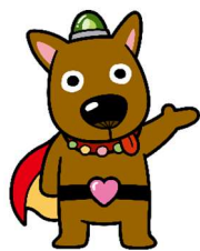
丸亀市社協キャラクター オルデ